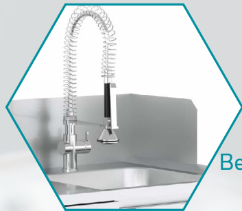
Becken mit Schlauchpendelbrause