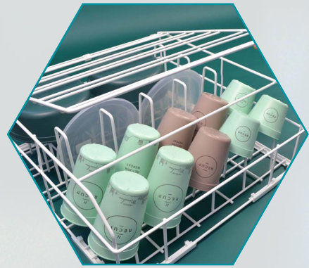
Becherkörbe mit Niederhaltegitter