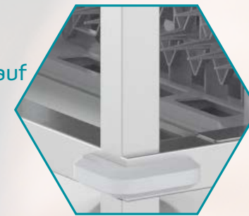
Wannen mit Ablauf