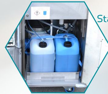
Stauraum für Reiniger und Wasseraufbereitung