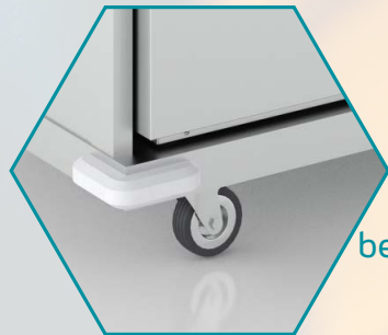
bewegbar und staplerfähig